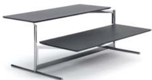
ACCA II 2005