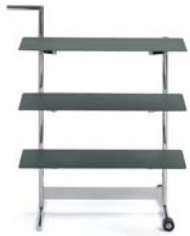
Basaltgrau basalt grey

Mesa auxiliar con tableros móviles situados a tres alturas. Estructura de acero cromado con dos ruedas. Tableros de acero, microestructura de laca pulverizada. Detalles y colores ver lista de precios.