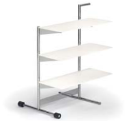
Cremeweiß cream white