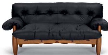
Leder schwarz leather black

Hecho a mano. Estructura de madera maciza de Tauari. Barnizado y con una capa de laca transparente. Acolchado: poliuretano con espuma de poliéster. Tapicería de cuero o tela.