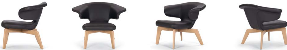
Munich Lounge Chair

Estructura de roble o nogal barnizado con una capa de laca transparente. Acolchado: Carcasa de fibra de vidrio de varias densidades en el interior. Tapicería de tela o piel. En cuanto a resistencia, durabilidad y seguridad, el sillón corresponde al nivel 2 de la norma EN 15373:2007.