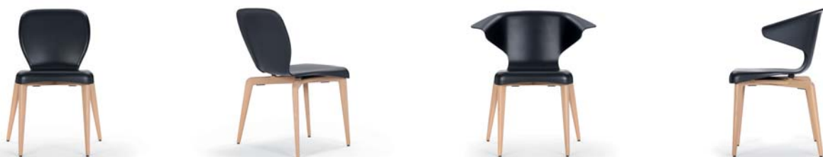
MUNICH CHAIR 2009