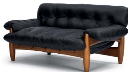
MOLE SOFA 1961