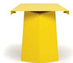
Rapsgelb rap yellow