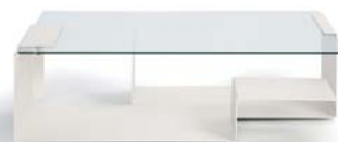
DIANA D 2002