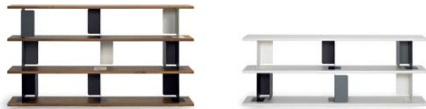
Amerikanisch Nussbaum walnut

Baldas de chapa de nogal americano o MDF lacado en gris claro con elementos de acero en laca pulverizada (intercambiables entre sí). Puede aumentarse la altura con un elemento elevador. Patas de mueble con centrado preciso. Detalles y colores ver lista de precios.