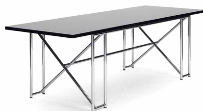
DOUBLE X 1928