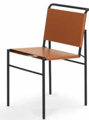
Leder cognac leather cognac