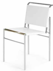
Leder weiß leather white