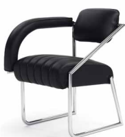
NON CONFORMIST 1926