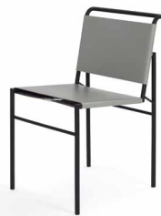
Leder grau leather grey