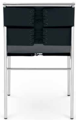
Leder schwarz leather black

Estructura de tubos de acero cromado o pulverizado. Asiento y respaldo de cuero ceñido. Detalles y colores ver lista de precios.