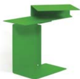
DIANA E 2002