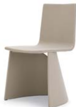
Divina beige beige