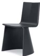
Leder schwarz leather black

Silla de madera cubierta. Acolchado: poliuretano. Tapicería de tela o de cuero. Acabado de las patas en goma. Detalles, colores probado ver lista de precios.