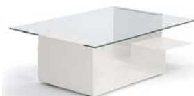
DIANA D 2002