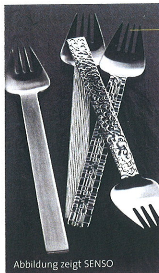
Abbildung zeigt SENSO