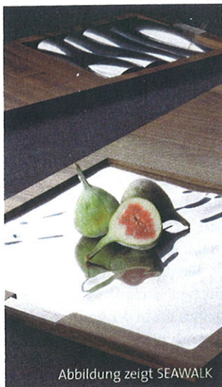
Abbildung zeigt SEAWALK